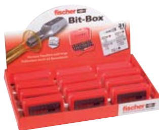
Набор бит FPB, 31 предмет в упаковке Display по 12 штук