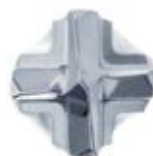
Наконечник бура ø 6-16 мм