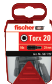
Биты Profi-Bit FPB в пластиковом контейнере