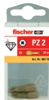
Биты FDB в пластиковой упаковке