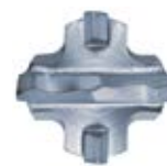
Наконечник бура ø 18 мм