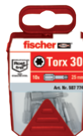
Биты из нержавеющей стали FSB в пластиковом контейнере