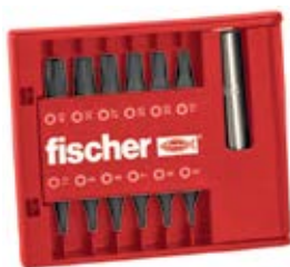
Набор бит FPB Profi, 13 предметов